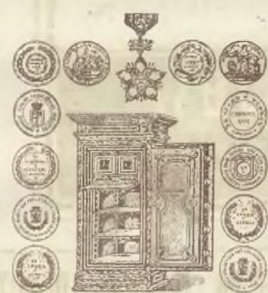
Najstarsza fabryka ogniowatych Kas

Wielki wybór materyałów na podarunki na Nadechodzące Święta. Wielki wybór sukien w pudełkach, Tiulowe i gazowe suknie na wieczory i bale.