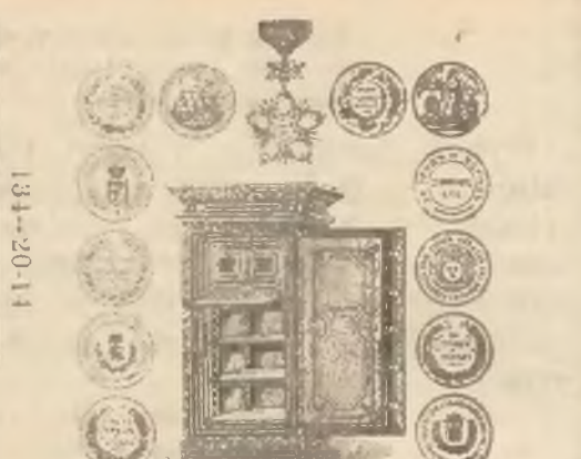
Najstarsza fabryka pancernych ogniotrwałych kas

2 pokoje do wynajęcia, front, można na kantor lub biuro. Wiadomość: Luteranska Nr 7, m. 1 828