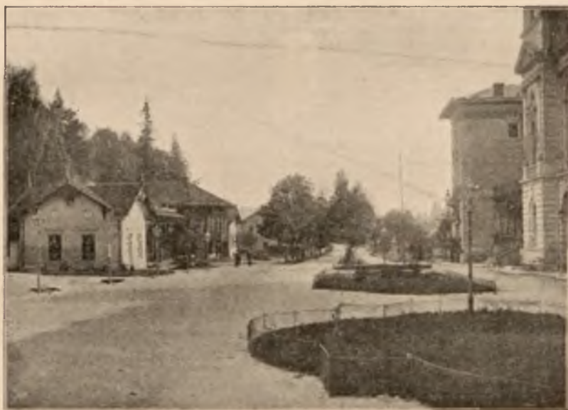
ZDRÓJ GŁÓWNY W KRYTYM DEPTAKU.

Od 15-go czerwca osobne bezpośrednie wagony z Krakowa i Lwowa.