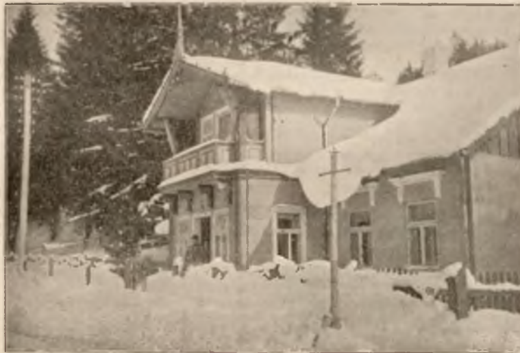
DOM POD „ZIELONĄ GÓRKĄ“ W ZIMIE.

Od 15-go czerwca osobne bezpośrednie wagony z Krakowa i Lwowa.