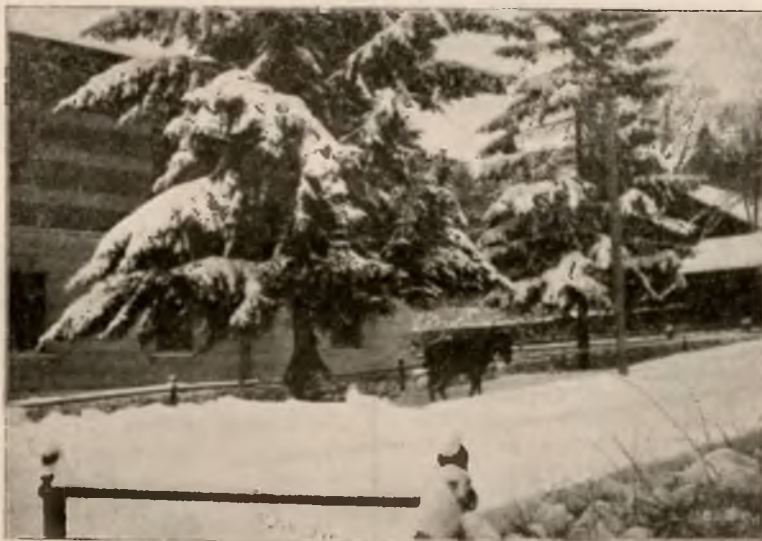
MOTYW Z KRYNICY W ZIMIE.

Od 15-go czerwca osobne bezpośrednie wagony z Krakowa i Lwowa.