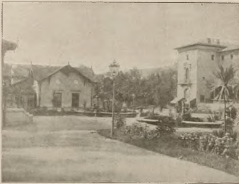
PLAC PRZED DOMEM ZDROJOWYM.

Od 15-go czerwca osobne bezpośrednie wagony z Krakowa i Lwowa.