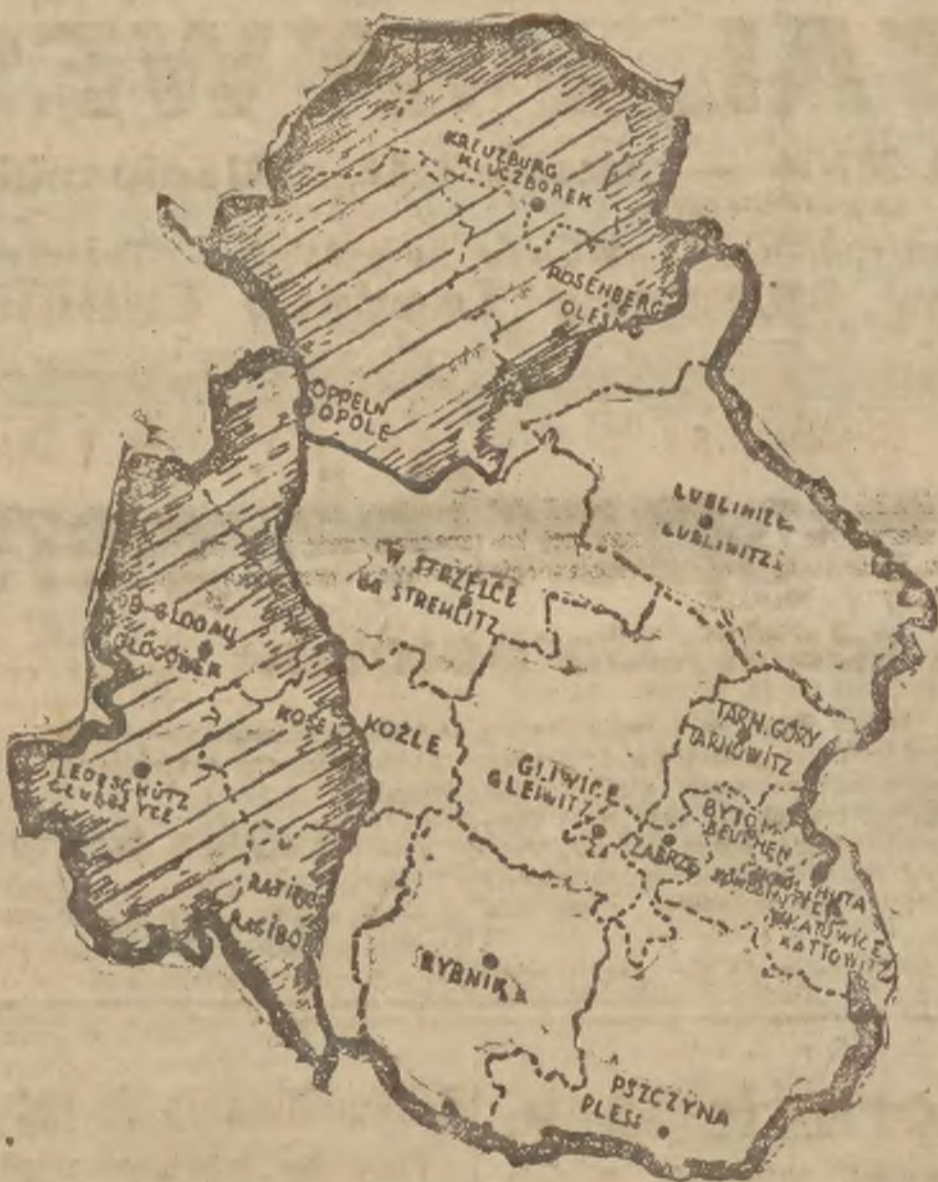
Przegląd powyższa przedstawia blok, obejmujący powiaty: pszczyński, rybnicki, bytomski, katowicki, zabrzański, gliwicki, tarnogórski, lublinitzki, strzelecki, oraz części, leżące po prawym brzegu Odry, powiatów raciborskiego i kozieńskiego, południową część powiatu oleskiego oraz skrawki opolskiego. Powiaty o większości niemieckiej oznaczone są na mapce kreskami.

Osobny rozdział dziejów plebiscytu stanowi terror, który w ostatnich czasach osiągnął niebываłe rozmiary. Wskutek tego zwłaszcza ludność w powiatach rolniczych nie miała odwagi swobodnie się wypowiedzieć. Terror ten osiągnął największe natężenie w samym dniu głosowania, kiedy to otaczano lokale wyborcze stostrupami, którzy w ostatniej chwili terroryzowali Polaków. Biura wyborcze były ozdobione plakatami niemieckimi. W szeregu miejscowości stwierdzono, że nie dotrzymywano tajemnicy głosowania, gdyż hałasatorzy wychodzili do celów wyborczej lub innym sposobem kontrolowali, w jaki sposób ktoś głosuje. Gdzie indziej wydawano głosującym tylko niemieckie kartki. W szeregu miejscowości sami Niemcy członkowie biura wyborczego nakłaniali w lokalu do głosowania za Niemcami. W innych miejscowościach (jak w powiecie kluczborskim) nie dopuszczono polskich emigrantów do głosowania.