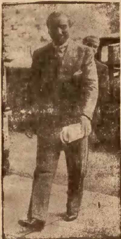
GRANDI przedstawiciel Włoch