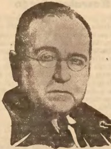
Getulio Vargas, prezydent-dyktator Brazylii

W tej trudnej sytuacji zjawia się nagle po-