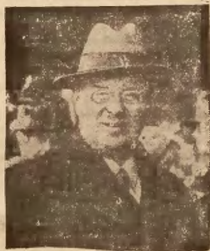
B. ambasador sowiecki w Paryżu Potemkin wymieniany jest jako następcą komisarza Litwinowa, którego stanowisko podobno ma być mocno zachwiane.