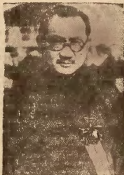
Dr. K. H. Kung, szwagier Czang Kai Szeka, objął po nim stanowisko szefa rządu chińskiego. Czang Kai Szek zatrzymał tylko godność głównodowodzącego armii.