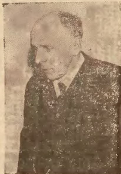
Najnowsze zdjęcie przebywającego obecnie w Ameryce lorda Roberta Cecila, który otrzymał nagrodę pokojową Nobla.