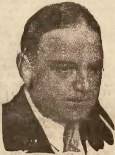
BURMISTRZ LA GUARDIA

Nowy Jork, 2. 4. ŻAT. Burmistrz Nowego Jorku La Guardia wystąpił na publicznym zebraniu zwołanym przez kongres żydostwa amerykańskiego bardzo gwałtownie przeciwko Hitlerowi i reżimowi nazistycznemu. La Guardia oświadczył, że reżim nazistyczny jest groźbą dla pokoju, to też jest on pewny, że światła opinia całego świata wkrótce zniweczy to niebezpieczeństwo. Szczególnie gwałtownie za-