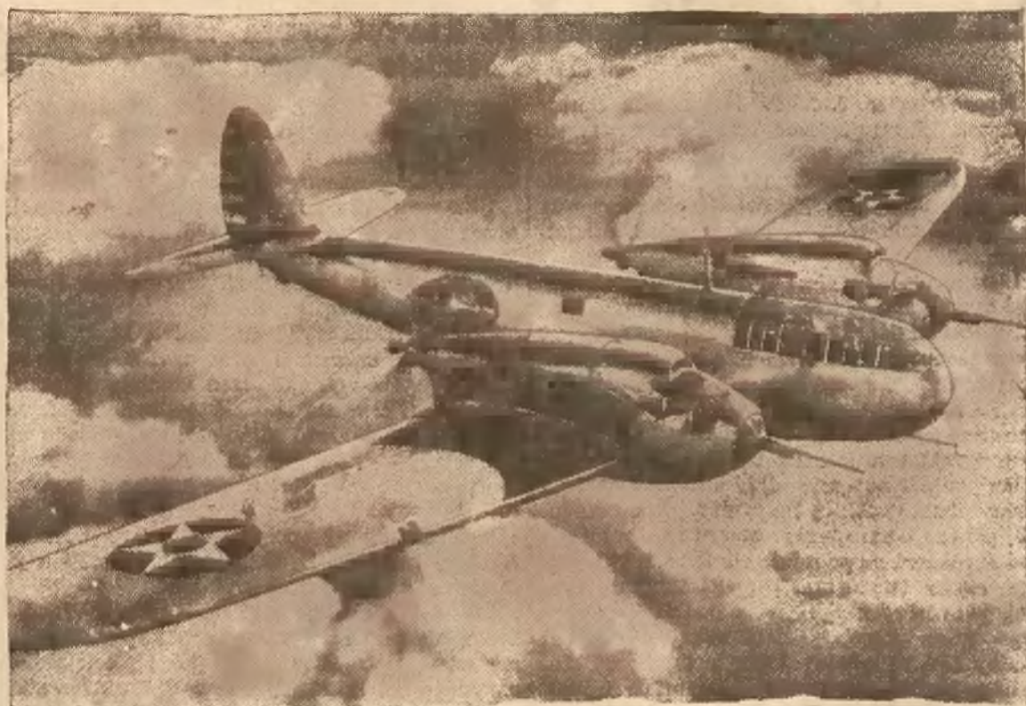
Najnowszy samolot produkcji amerykańskiej, przeznaczony dla Anglii