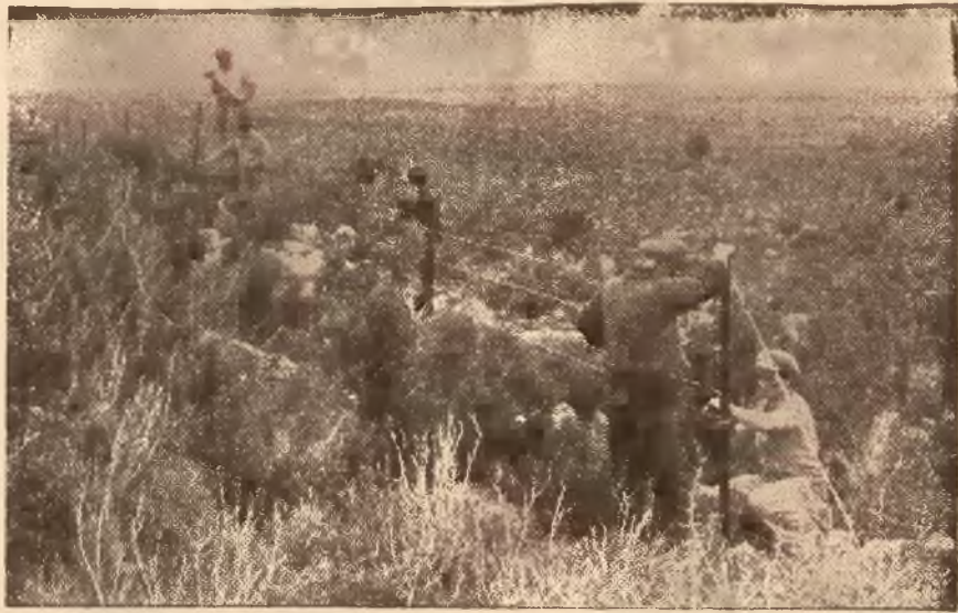
Specjalny oddział ołoczył obóz zasiekami z drutu kolczastego.