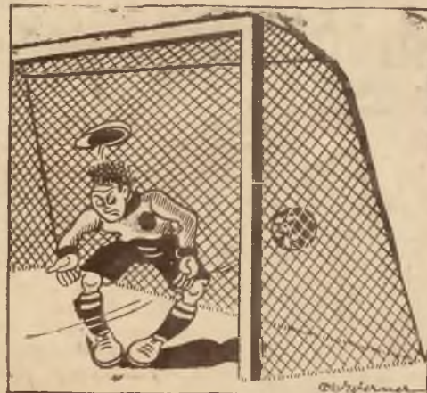
Bramkarz nie powinien mieć krzywych nóg.

niż w KRAKOWIE, RYNEK GŁ. 14. II. p. (nad Dolką) gdzie można kupić 40—50% niż cen normalnych. Ewent. ugił w śpiątkach