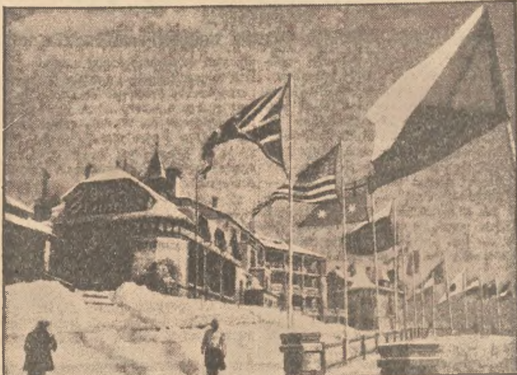
Międzynarodowe zawody narciarskie FIS'u odbywają się obecnie w Tatrzńskiej Lomnicy w Tatrach. Na zdjęciu Lomnica, udekorowana flagami wszystkich narodowości, biorących udział w bieгах.