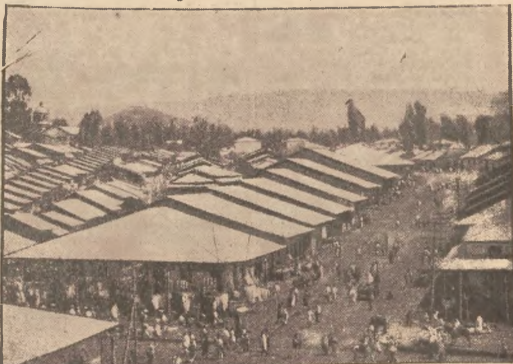
Dzielnica handlowa w stolicy Abisynji Adis Abeba.