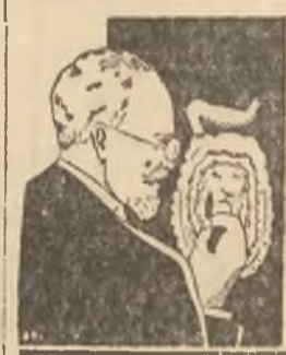
Do moczenia bielizny: HENKO, soda do prania i bielienia.

CHORY ŻOŁĄDEK JEST NIERAZ POWODEM POWSTAWANIA NAJROZMAITSZYCH CHOROÓB ZIOŁA Z GOR HARCU Dra LAUERA są dobrym środkiem dla uregulowania żołądka, usuwają obstrukcję, są łagodnym naturalnym środkiem przeczyszczającym, usuwają substancje gnilne, zatrzymujące organizm ZIOŁA Z GOR HARCU Dra LAUERA stosowane również przy cierpieniach wątroby, nerek, kamień żółciowych i hemoroidach są chętnie przyjmowane przez chorych