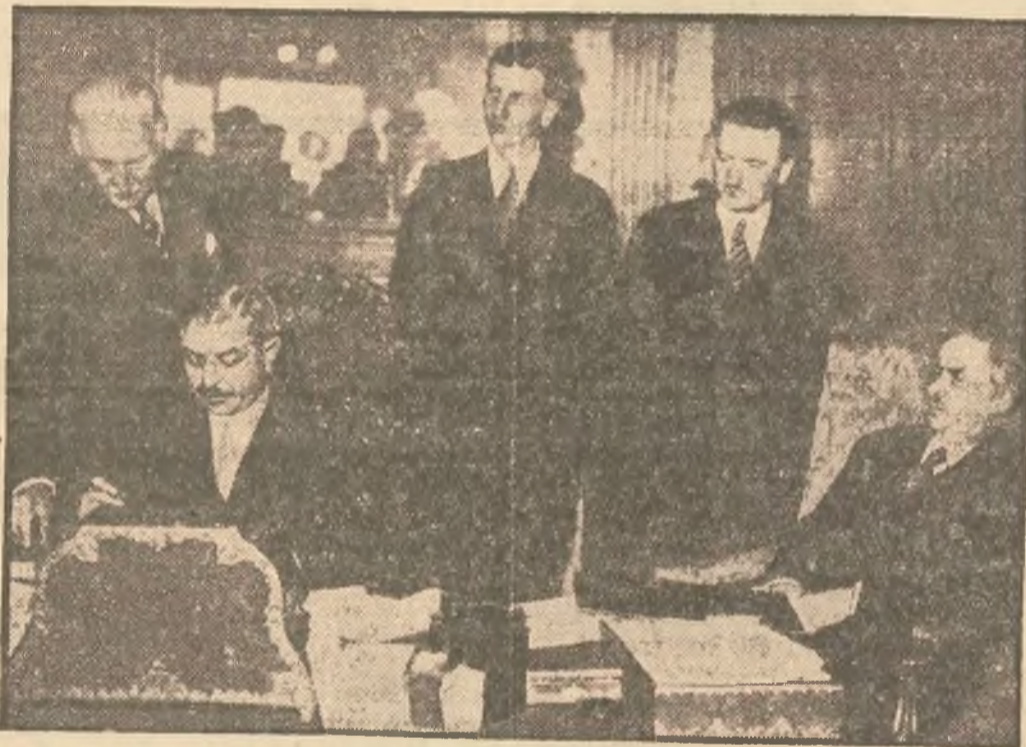
Min. Laval kładzie swój podpis na dokumencie paktu francusko-rosyjskiego. Obok siedzi ambasador sowiecki Patiomkin.

Jak więc widzimy, Rosja zrezygnowała z automatyzmu pomocy francuskiej na wypadek zatakowania jej przez stronę trzecią zgodziła się na konsultację Ligi Narodów, uznała w całej rozciągłości paktów locarneńskie, oraz zaakceptowała stanowisko Francji, że pakt wzajemnej pomocy może mieć zastosowanie tylko do Europy. Napewno pakt nie wygląda tak, jak sobie swego czasu wyobrażał śp. Barthou, a obowiązek konsultacji Ligi Narodów jest tylko na ręce Niemiec, które liczą głównie na nagłość i gwałtowność uderzenia. Ale bądźco bądź podpisanie paktów wzajemnej pomocy między Francją a Rosją jest aktem olbrzymiej doniosłości politycznej. Pakt ten jest przedewszystkiem ostrzeżeniem pod adresem Niemiec, które muszą być zgóry przygotowane, że sprowokowanie wojny spotka się z oporem całej Europy. Nie ulega też chyba wątpliwości, że Laval, który przybywa dnia 10 bm. do Warszawy, a stąd pojedzie dopiero do Moskwy, usilnie starać się będzie o to, by raz na zawsze usunąć dysonanse między Polską a Francją i ożywić przyjaźń polsko-francuską duchem dawnego zaufania. Nie jest też wykluczoną rzeczą, że uda się znaleźć formułę, któraaby Polsce umożliwiła przyłączenie do tak zmodyfikowanego paktu wschodniego.