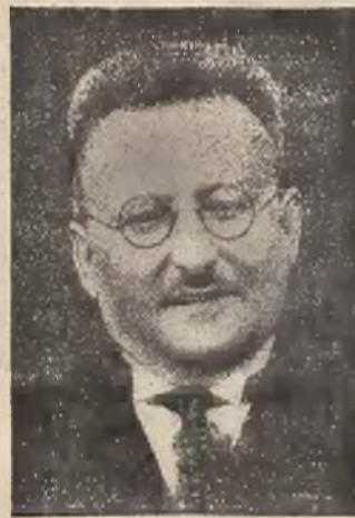
został socjalista Paweł Loebe wybrany trzecim wiceprzewodniczącym Reichstagu.

nata jarzy się tysiącem, setką tysięcy świateł. W otwartych drzwiach stoi bez ruchu para panujących, połyskując złotem i klejnotami. Aż po ziemię kłania się pstrokata sala. Para królewska wstępuje na tron. Zanim król czytać zaczyna mowę, wypowiada historyczne słowa: „My Lords pray be seated“. Wzywając, żeby słuchać słów monarchy siedząc, król zaostrza w pieczęć najstarsze prawa szlachty. W osobie kilku ministrów i posłów na tylnym planie sali ukazują się przedstawiciele narodu: Izba Gmin. Mowa króla jest krótka. Natychmiast po pierwszych słowach król z królową opuszcza salę, na której złoto i purpura znówu kłania się nisko. Za swiata królewską zamykają się drzwi. Tysiące świateł gaśnie. Najwytworniejszy akt państwowy angielskiej zimy skończył się.