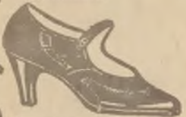
D. Lak. z ramsz. komb. szykowny model