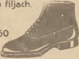
M. czarne oksowe całe oraz półbutelki czarne i brązowe