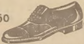
M. lakier. i skórz. czarne i brązowe oraz butelki całe pasowo szyte