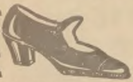
D. lakier, na pł., słupk. i franc. obe. w trwałym wykonaniu