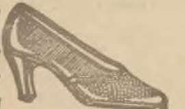
D. bronz. oraz niebiesk. „Nakko” z imit. jaszcz. skóry kombinow., szczyt elegancji