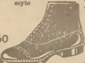
M. z podw. podsz. wąż oraz półbutelki lakier. i skórz. czarne i bronz. spec. wyk.