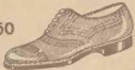
M. brązowe i czarne półbutelki oraz całe