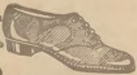
D. bronz. boka. w najmodn. komb. na płask. i słupk. obe. pas. szyte, ostatnia nowość