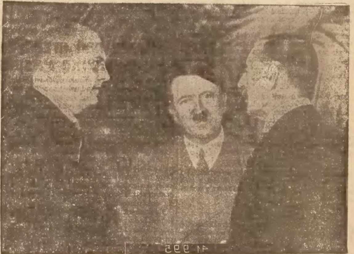
Stoją od strony prawej: premier Chamberlain, kanc. Hitler i tłumacz, radca legacyjny Schmidt