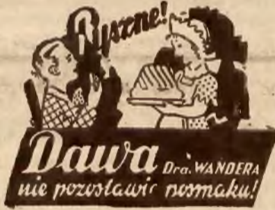
Pokazy pieczenia na proszku Dawa odbywają się codziennie w lokalu propagandowym Elektrowni Miejskiej, Jagiellońska 2.

Obchodzi się w tej chwili święto „marszu na Rzym”. Ale to nie tylko radość z powodu tego marszu sprzed lat szesnastu, ale tego, który wciąż trwa. Który odbył Adolf Hitler, Stojadi-