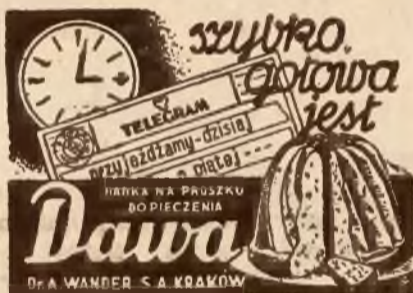
Pokazy pieczenia na proszku Dawa odbywają się codziennie w lokalu propagandowym Elektrowni Miejskiej, Jagiellońska 2.

Fakt ten ma niezwykle znaczenie dla obrony kraju. Mamy już dzisiaj około 10.000 żydowskiej policji pomocniczej, rozsianej po ca-