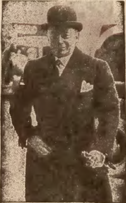
PAUL REYNAUD nowy francuski minister skarbu

Po niespodziankach, rozgrywających się na szachownicy europejskiej, mamy oto niespodziankę w zakresie spraw wewnętrzno-francuskich. Słuchając energicznych przemówień programowych premiera Daladier i ministra finansów Marchandea, wygłoszonych na kongresie partii radykałów w Marsylii, można było mieć pewność, że rząd opracował już program ratowania finansów i gospodarki Francji i że dekrety, których ogłoszenie zapowiedziano na 2-go listopada, stanowić będą energiczną i metodyczną kampanię wybrnięcia z trudnej sytuacji. Długie opracowywanie tych dekretów, w zupełnej tajemnicy napawało ogół otuchą.