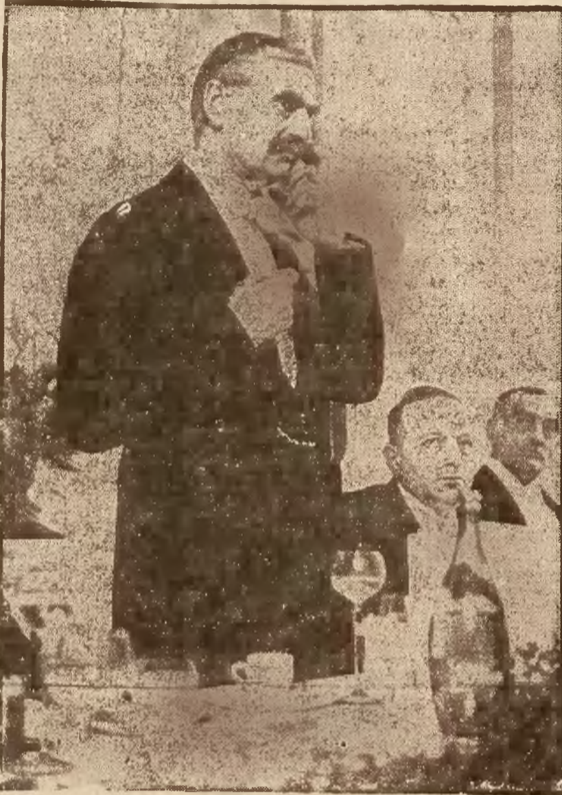
Premier Chamberlain wygłasza swą wielką mowę na bankiecie prasy z granicznej.

Ale rzekome oburzenie niemieckie nie ma nic wspólnego z ich kartagińską wprost zachłannością na pieniądze, połączoną z niemałymi precedensami metodami, wobec których jak się jeden z dostojników Kościoła wyraził postępowanie Nerona było łagodnym. Niemcy, którzy wywołali taką katastrofę, zniszczyli tyle egzystencji, uważają, że postępują zgodnie z nakazami nazistowskiej moralności, skoro dążą do zagarnięcia znacznej części pieniędzy, które zebrane przez tego samego Lorda Baldwina mają na celu ulżenie doli unieszczęśliwionych ludzi. Ich „pian”, który swoją zuchwałością przechodzi wszystko co w ostatnich 5 latach wyszło z tego kraju, jest w zasadzie prosty. Oficjalne okupy (jak w Chicago w swoim czasie) płacone funtami, pochodzącymi ze zbiorów angielskich, mają zapewnić wolność części 35-cio tysięcznej rzezy Żydów zamkniętej w niemieckich obo-