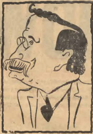
Blum, przywódca socjalistów.

Z początku szło to jakoś. Z początku Anglicy nic nie mieli przeciw temu, by rząd francuski w ten sposób się przechwalał — aż do ukończenia wyborów.