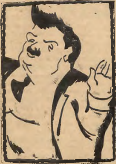
Herriot w karykaturze.

Przyznajmy to szczerze: zamieszanie w Europie wzrasta bezustannie. Już nietylko Niemcy gwałcą międzynarodowe traktaty. I Austria zawarła już traktat, zawarty w Saint-Germain. Cóż więcej: potraktowała z lekceważeniem rezolucje Ligi Narodów uchwalone w powyższej sprawie, tej Ligi, która Austrię tak często i tak wydatnie wspierała. Na notę protestacyjną Małej Ententy, Austria odpowiada deklaracją, w której powołuje się na „konieczności życiowe austriackiego rządu“. Można w dodatku przypuszczać, że ta decyzja jest prostą konsekwencją ostatniego przymierza, zawartego w Rzymie między Austrią Węgrami i Włochami. Jeśli Austria rezygnuje odtąd z poparcia Ligi Narodów to bezwątpienia — że się to może dla niej czemś niezwykle poważnym. Ale równocześnie — musimy to przyznać — jest to fakt o niezwyklej doniosłości również i dla genewskiej instytucji.