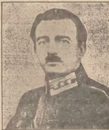
Prezydent albański Achmed Zogu.