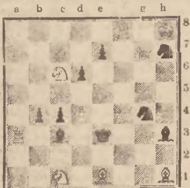
Mat w dwóch posunięciach.

Czarne: Ke3, Sg4, Sh7, Lc3, Lh3, Pb4, c4, d6, e7 (9 fig.).