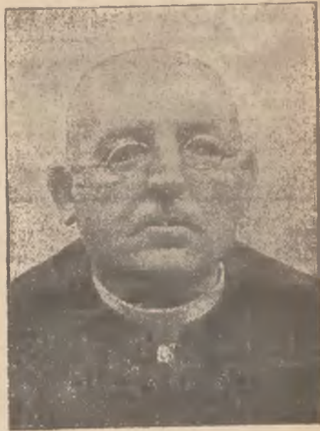
Przewodca chrześcijańsko-społecznych w Austrii, ks. Seipel, który nadal pozostaje kanclerzem.

tywnie i wystarczająco bezpieczeństwo różnym krajom. Zapewnienie gwarancji bezpieczeństwa wymaga z kolei stworzenia nowej organizacji ekonomicznej, która przyczyniłaby się skutecznie do usunięcia jednej z poważnych przyczyn powstawania konfliktów wojennych.