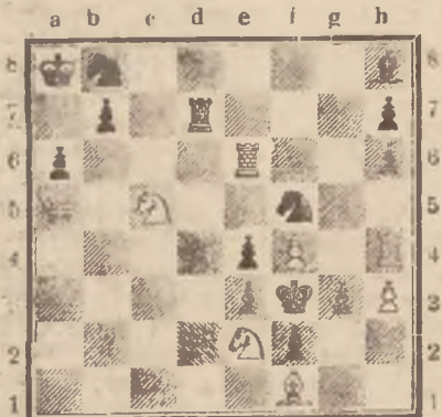
Mat w trzech posunięciach.

Czarne: Kf3, Wd7, Lh8, Sb8, Sf5, Pa6, b7, e4, e3, f2, g3, h6, h7 (13 fig.).