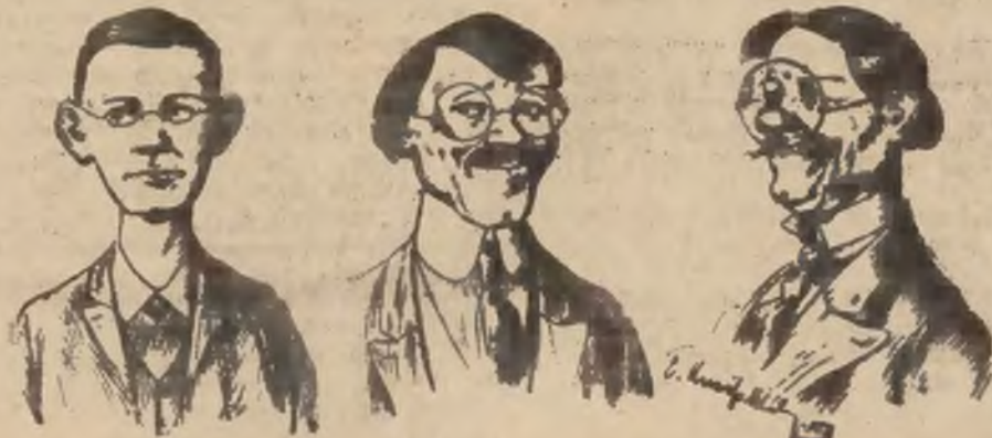
Z teki wynalazków: Ewolucja okularów.

pieczeniowej w drodze dekretu Prezydenta Rzeczypospolitej