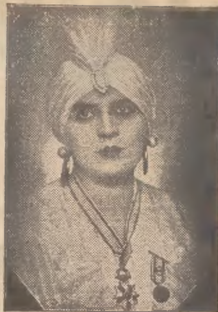
Światowej sławy indyjska fakirka