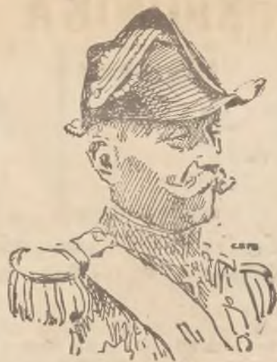
W tych dniach dokonano w Atenach zamachu na prezydenta republiki greckiej Konduriotisa, którego widzimy na naszym obrazku.