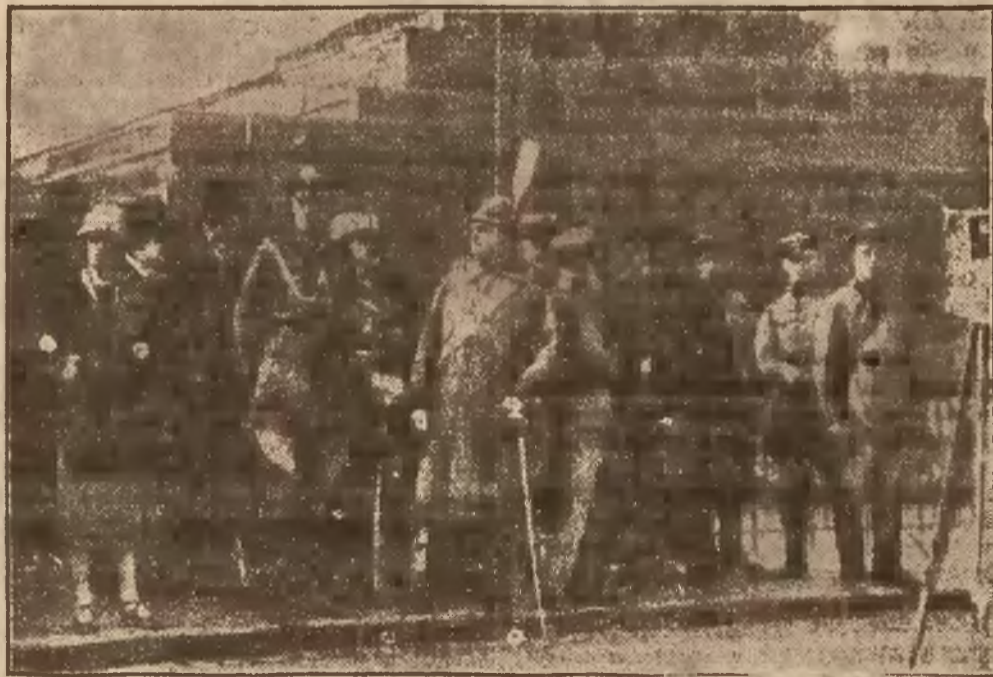
Zagraniczni attachés wojskowi oraz dyplomaci przed Kronem podczas parady Czerwonej armii.