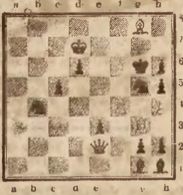
Mat w trzech posunięciach.

Białe: Kd7, De2, Wf4, Wg3, Lg8, Pf6, h4 (7 fig.). Czarne: Kg5, Lh1, Lg1, Sb4, Sg5, Pc5, d6, e3, g2, h3, h5, h2, (12 fig.).