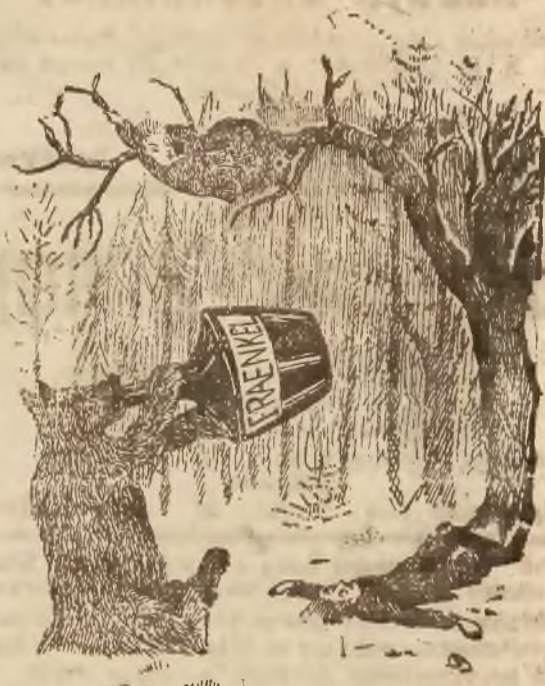
Proj. „Prasa” Kraków

Ciekawy wypadek zdarzył się pewnym myśliwym, na których w czasie śniadania rzucił się potężny niedźwiedź. Od niechybnej śmierci uratował ich LIKIER FRAENKLA .