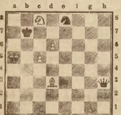
Białe zaczynają i uzyskują remis.

Poniżej podajemy ładną partję z wielkiego turnieju w Nowym Jorku w 1924 r.