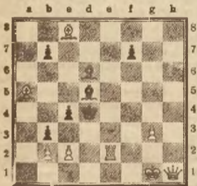
Mat w dwóch posunięciach.

Czarne: Kd4, Ld5, Ld6, Pb7, b3, c4, f7 (7 fig.).