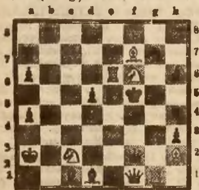
Mat w dwóch posunięciach.

Czarne: Kf5, Df2, Wa7, Wb4, Lc1, Ld1, Sg7, Pa6, a4, d5, h6, h3 (12 fig.).