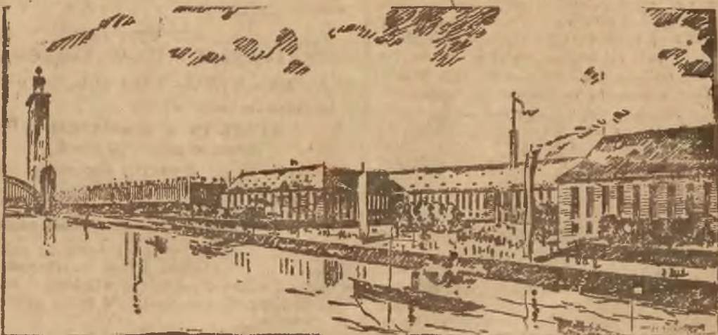
Gmach muzealny, mieszczący wystawę kulturalno-historyczną i grupy oddzielne. W tyle gmach główny tzw. Hala reńska z wieżą.

państw i narodów biorących udział w Pressie. W nocy zwłaszcza rozlata się wspaniały widok, gdy teren wystawowy rozświetli morzem światła odbijającego się efektownie w Renie a po lewym brzegu rzeki wystrzelają ku niebu oświetlone wieżycy przepięknej katedry kolońskiej oraz ilumin-