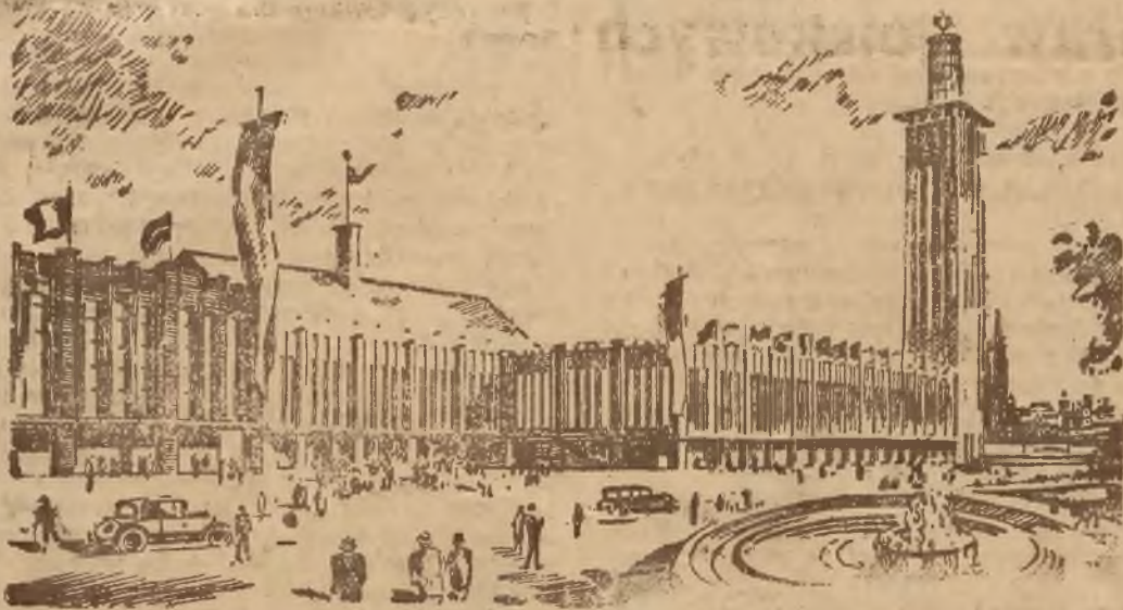
Część hali reńskiej widziana od strony Staatenhausu. Po lewej t. zw. Kongresshaus, po prawej oddział „Nachrichtentechnik“.

Ale nie na tem koniec! Liczne pawilony i terasy mieszczące kawiarnie i restauracje, rodzaj Prateru wiedeńskiego, teatr marionetek, zbudowany przez „Münchener Illustrierte“, kino oraz niezliczona ilość kiosków i domków składa się na nader urozmaicony obraz upstrzony barwami krajów,