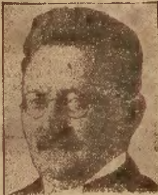
Socjalista Paweł Loebe został, jak wiadomo, ponownie wybrany prezydentem Reichstagu