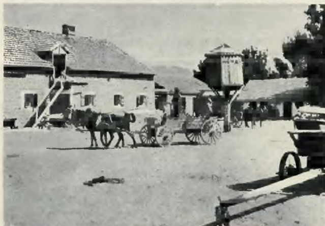
Podwórze w Daganji Alef

U góry w środku: Schludny domek kolonisty w osiedlu Pardes Chanach