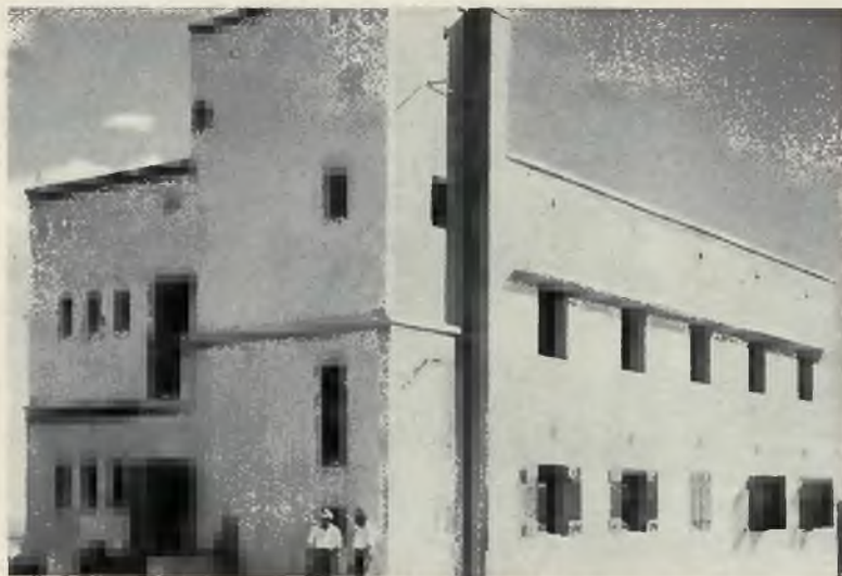
Drugi dom mieszkalny Gdud Haawoda w Ramath Rachel