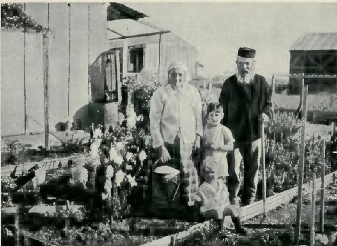
Starzy i młodzi w Erec Izrael