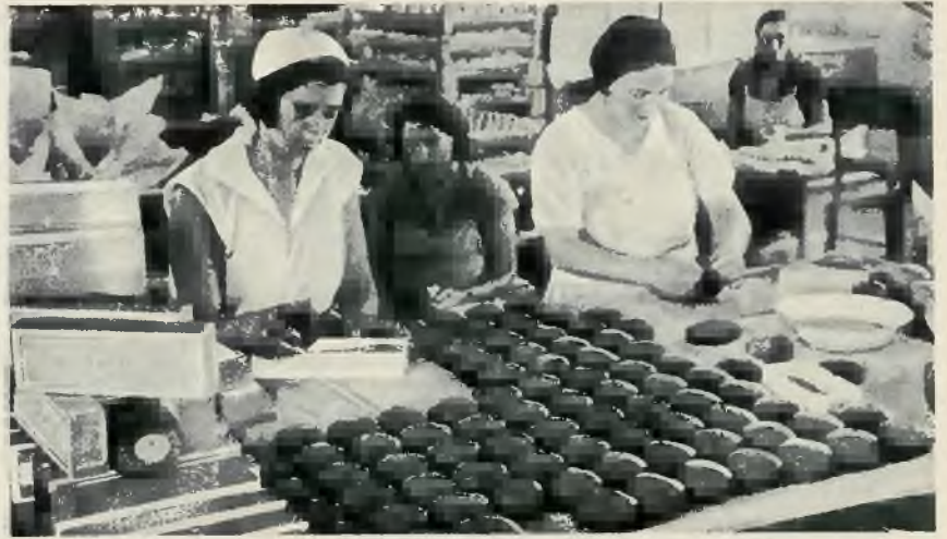
Oddział fabrykacji mydła w fabryce „Szemen”