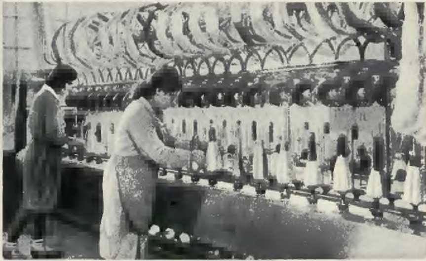
Fabryka pończoch „Lodzia” w Tel Awiw