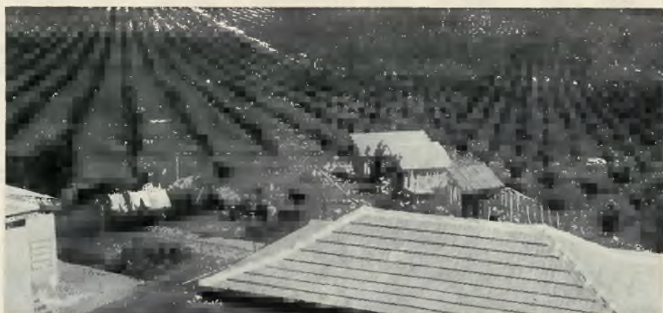
Gan Chaim z rozciągającymi się w dal plantacjami pomarańcz