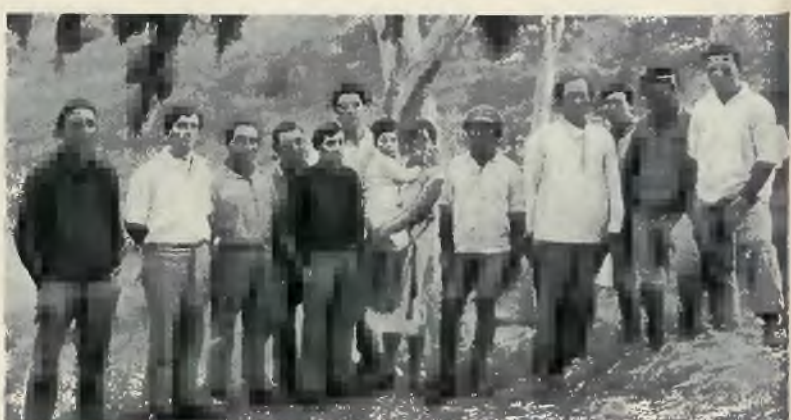
Pierwsi koloniści Wadi Chawarith