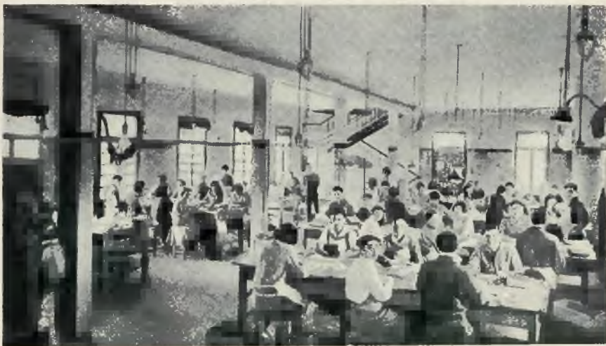
Wnętrze fabryki wyrobów skórzaných „Setge” w Tel Awiw