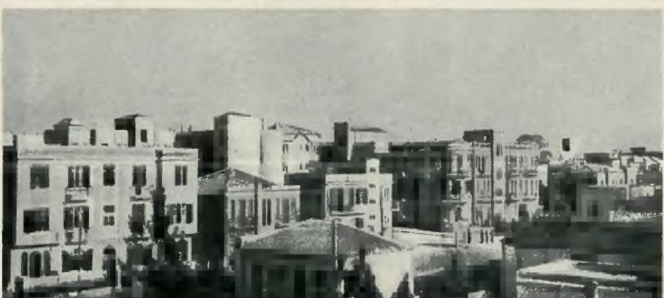
Jedna z noworobudowanych ulic w Tel Awiw (ul. Jawne)