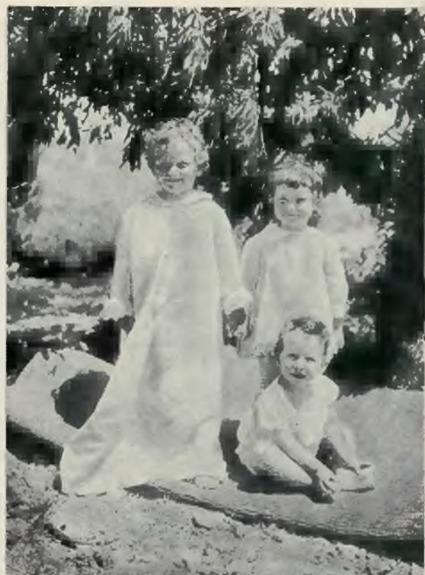
Nasi milusińscy w Erec Izrael