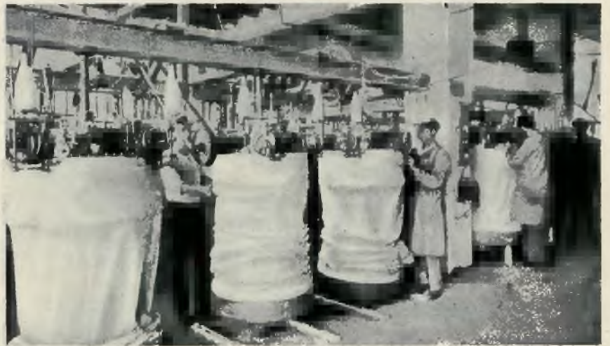
Hala maszynowa fabryki trykotażowej Libera w Tel Awiw