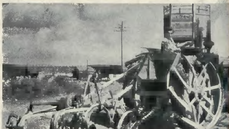
Nahalal przed jesienną kampanją rolną