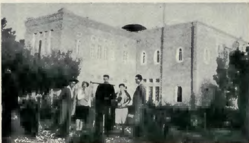
Jeden z nowych budynków uniwersytetu Hebrajskiego w Jerozolimie