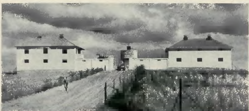
U wejścia do nowozbudowanej osady rolnej Kalmaniah