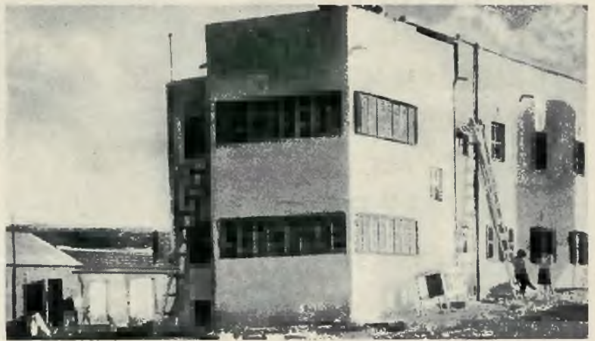
Nowy budynek szkolny w Miszmar Haemek.