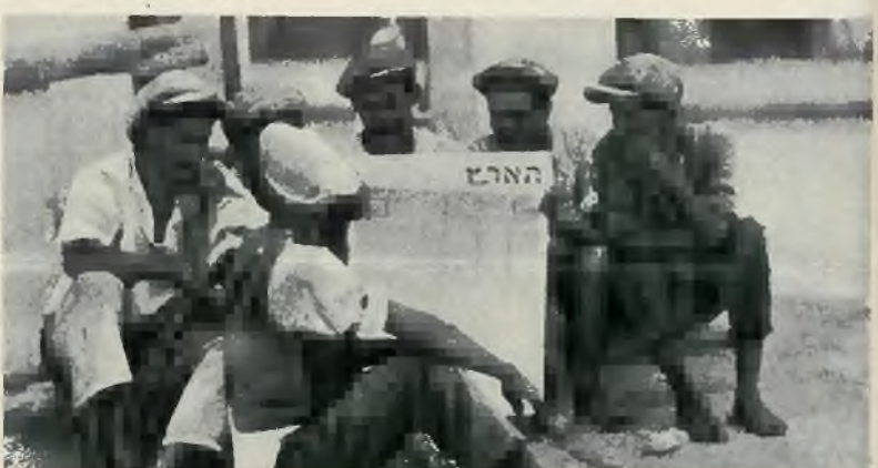
Idylla ulicy telawiwskiej. Jemenicki tragarze oddają się lekturze