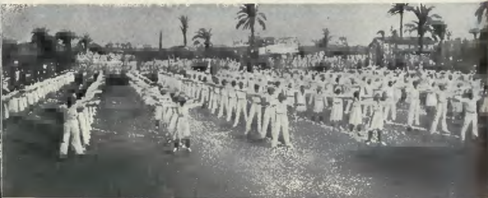
„Makkabi“ w Palestynie przygotowuje się do przyszłej „Makkabjady“