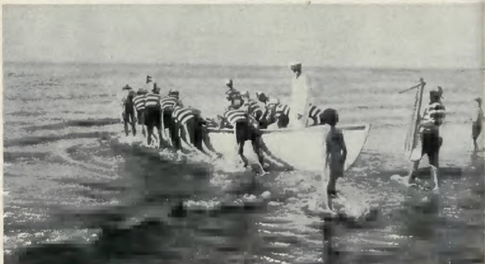
Z żyd. morskiego związku sportowego w Hajfie. Jedna z dzielnych drużyn oddziału „Delfin“ czyni przygotowania do przejażdżki