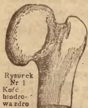
Rysunek Nr 1. Kość biodrowa, wazdrowego człowieka ma blyszczący wygląd i jest koloru blyskawo-niebieskawego. Patrz rys. Nr. 2.

WYLECZONO MNÓSTWO WYPADKÓW ZASTARZALYCH OD 30 I NAWET 40 LAT.