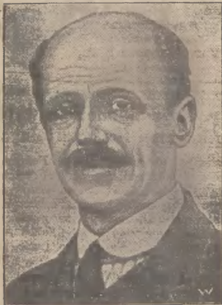
Węgierski prezydent ministrów hr. Bethlen.

Jak telegramy doniosły, afery węgierskich falszerzy pieniędzy zatacza coraz szersze kręgi