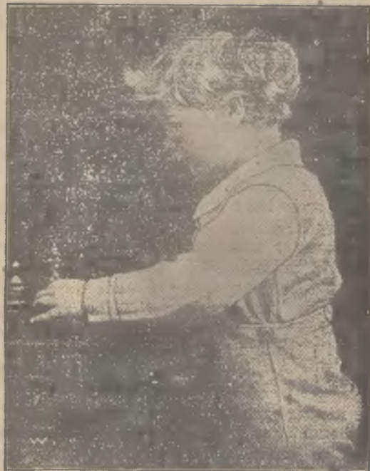
Czteroletni książę Michał (zajęty grą w szachy), syn księcia Karola, wskutek abdykacji swego ojca jest obecnie rumuńskim następcą tronu.