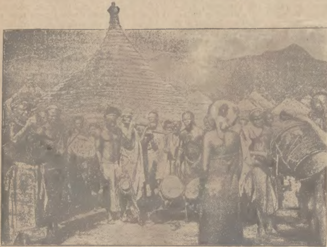
Kapela muzyczna ze swymi oryginalnymi instrumentami — wzór i źródła „naszego” modnego jazz-bandu.