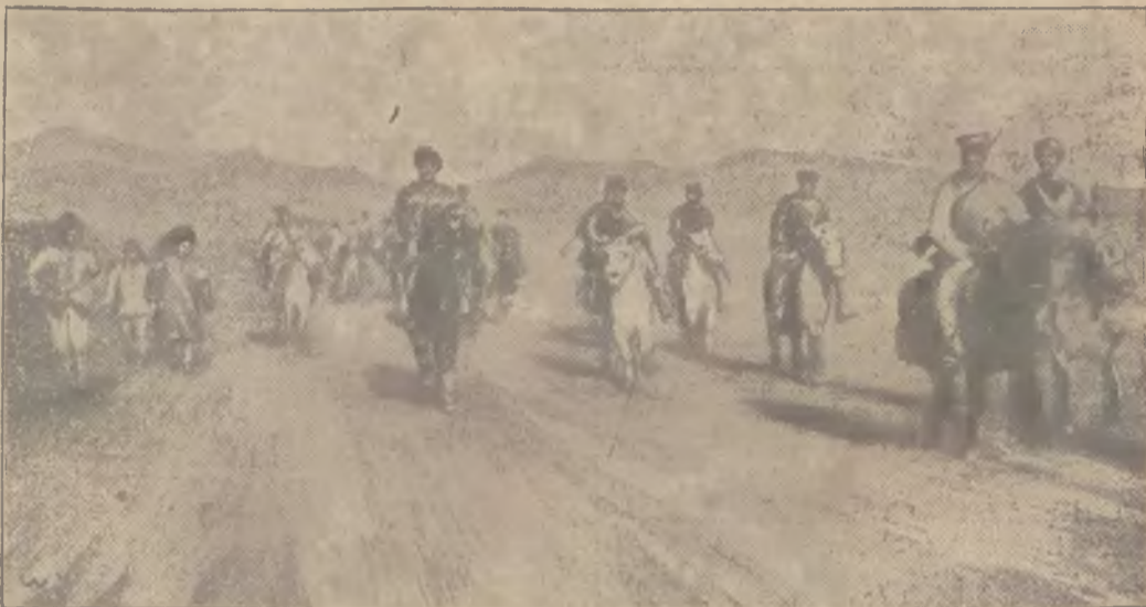
Ilustracja nasza jest jednym z najświeższych zdjęć z walk chińskich. Przedstawia scenę cofania się wojsk generała Fenga na Pekin.