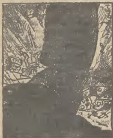
Mussolini wstępuje na ziemię afrykańską. (Humor holenderski.)

Zamieszki w Kalkucie, najbardziej cywilizowanemu mieście Indji dowodzą, że 300 milionów mieszkańców Indji nie stanowi bynajmniej solidarnej masy sfakcjonowanej wspólnym poczuciem narodowym. Prowadzenie Anglii w Indjach nie jest wprawdzie ustane różniami, ale prawdziwie dla Anglii groźna chwila jedności między tubylcami jest jeszcze bardzo odległa.