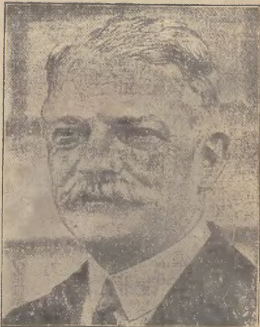
Były minister skarbu a obecnie prezydent Litwy francuskiej