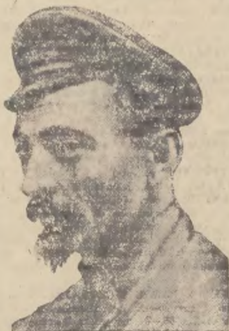
Feliks Dzierżyński, zmarły komisarz ludowy Rosji sowieckiej, były przewodniczący czerezwyczajki;