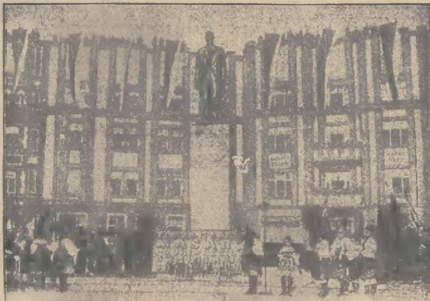
Pomniki za życia wchodzą coraz bardziej w zwyczaj... Ostatnio odsłonił znowu pomnik Masaryka w Hradcu Královym.