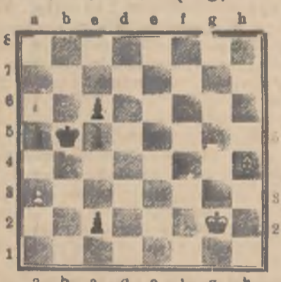
Białe zaczynają i uzyskują remis.