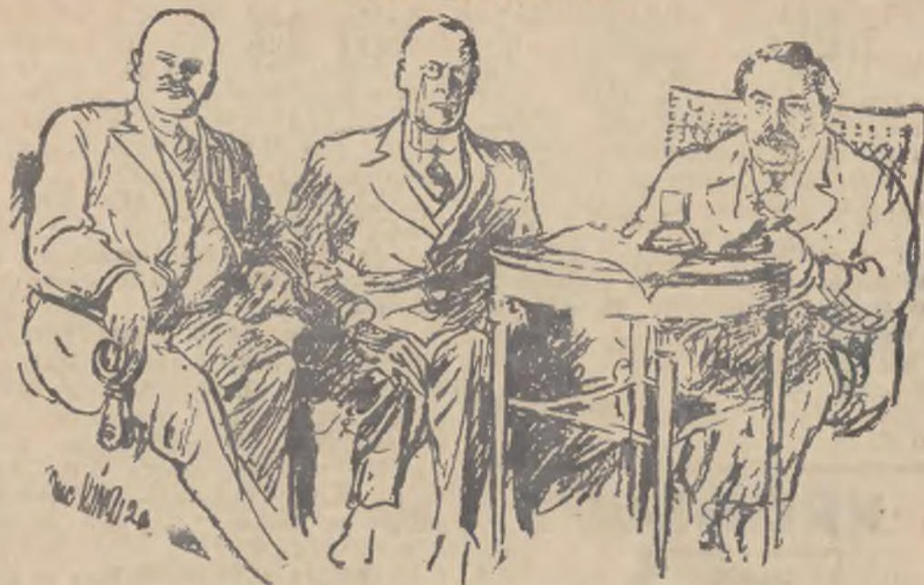
Siedzą od strony lewej ku prawej: Siresemann, Chamberlain i Briand