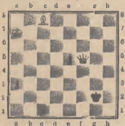
Mat w trzech posunięciach.