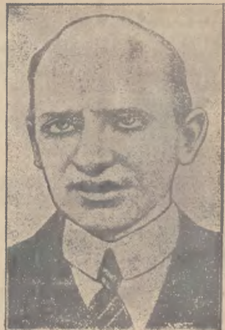
Minister Zaleski w Genewie

nister zaznaczył, iż kształtują się one coraz to pomyślniej, tak, iż można obecnie mówić o sta- bilizacji przyjaźni polsko-czeskiej.