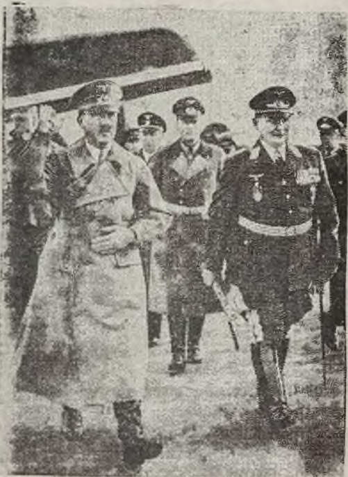
Kanclerz po przybyciu na lotnisko Tempelhof

ządu z marszałkiem Goeringiem na czele. Następnie przeszedł Kanclerz przed frontem kompanii honorowej. Jako pierwszy przemówił marszałek Goering oddając w ręce Kanclerza pełnomocnictwa które otrzymał na czas nieobecności Kanclerza. Dalej przemówił dr. Goebbels.