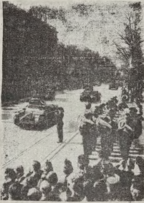
Parada wojsk pancernych przed Kanclerzem