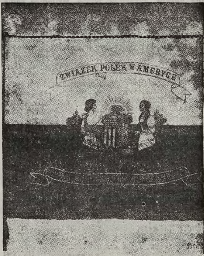
Sztandar Związku Polek w Ameryce

Odpowiedni wniosek rządu brytyjskiego zawarty jest w liście który w dniu 9 bm. nadszedł do sekretariatu Ligi Narodów, a który podpisany jest przez szefa wydziału południowo europejskiego Foreign Office, Filipa Nicholasa.