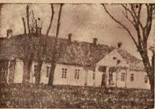
Gimnazjum i Liceum Rolnicze w Łososinie Górnej