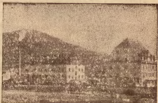
Spółdzielnia owocarska w Tymbarku

Mocno schorzałą gospodarkę rolną na ziemiach tutejszych dąłoby się uleczyć jedynie poprzez jaknajbardziej odpyły ludności wiejskiej na inne tereny rolne, względnie do przemysłu. To też jednym z najbardziej palących problemów na ziemiach górskich jest stworzenie tu silnego przemysłu. Z tej właśnie koncepcji narodziła się tymbarska spółdzielnia. Ale sam Tymbark, mimo szalonego