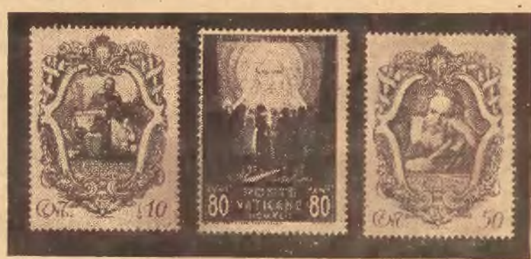
Nowe znaczki Włoch i Watykanu w naturalnej wielkości.

Katalog Michała nie ocenił należycie znaczków „GG”, a teraz, w pół roku po jego zredagowaniu przekonujemy się, że np. 5-złotówka urzędowa warta np. tylko 60 gr. za punkt, a przedruk 50/30 groszy nawet 5 zł. za punkt! Jednym słowem, to, co naprawdę rzadkie, odbiegło nieskończenie w cenę w porównaniu ze znaczkami znajdującymi się przez dłuższy czas