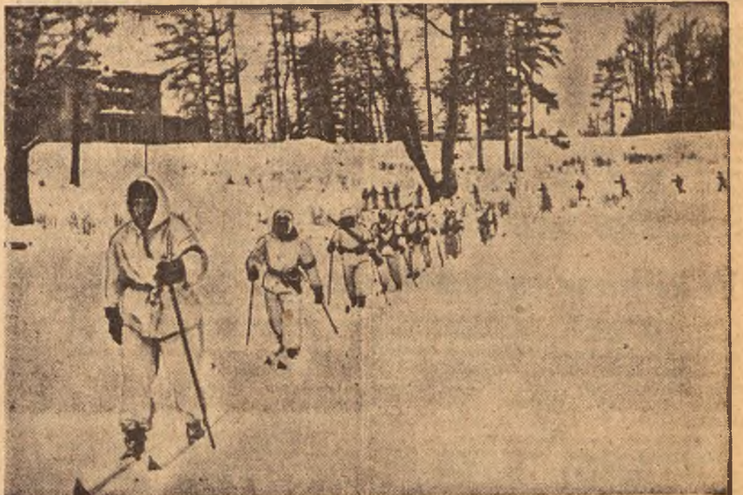
Transport rannych przedstawia podczas zimy na froncie wschodnim nieraz duże trudności. Na naszym zdjęciu po lewej widzimy oryginalny pojazd t. zw. uhhio, rodzaj sanek, na których ranni transportowani są do szpitala. — Na prawo: Hiszpańska kompania narciarska podczas wypraw na stanowisko bojowe.